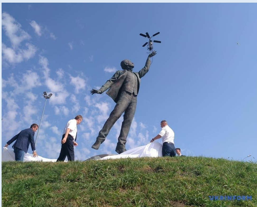
Ще один пам'ятник І. Сікорському у Києві, біля аеропорту Жуляни